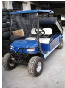
Utilitaire idéal pour sa grande capacité de chargement Benne électrique : Charge max : env 500kg