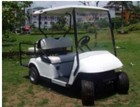
Golf car 6 places avec toit rallongé Golf car 4 places avec siège rabattable 2N1