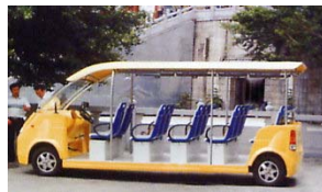
Véhicules de tourisme électriques de 8 à 14 places